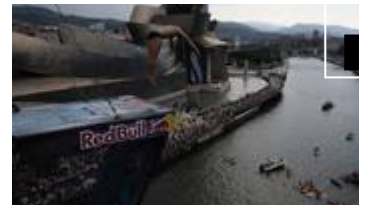
📹 Los clavadistas compiten y La Salve