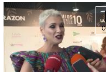
📹 María Jesús Ruiz desmiente rumores de embarazo

© DIARIO EL CORREO, S.A. Sociedad Unipersonal. C/ Pintor Losada 7 48004 Bilbao