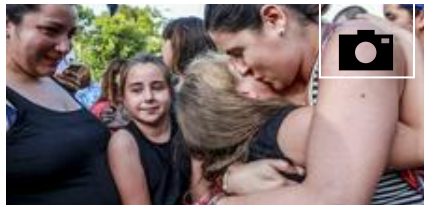
📹 De Bielorrusia a Álava. Un verano terapéutico