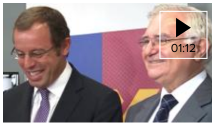
📹 La AN procesa a Rosell por blanqueo de capitales y organización criminal