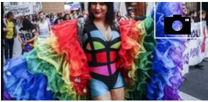
📹 La 'Green Capital' destaca su orgullo de color arco iris