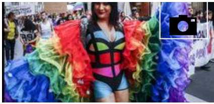
📹 La 'Green Capital' destaca su orgullo de color arco iris