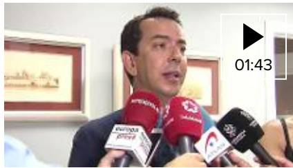
📹 El abogado del Guardia Civil de 'La Manada' da explicaciones