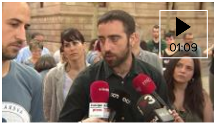
📹 El abogado de acusados por "Caso Montoro": todo ha sido proceso "político"