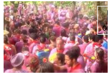
📹 12.000 personas acuden a tradicional Batalla del Vino de

© DIARIO EL CORREO, S.A. Sociedad Unipersonal. C/ Pintor Losada 7 48004 Bilbao